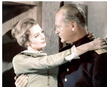
1961 LE TRIOMPHE DE MICHEL STROGOFF de Victor Tourjansky avec Capucine