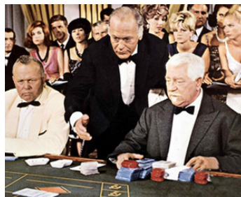
1966 LE JARDINIER D'ARGENTEUIL de Jean-Paul Le Chanois avec Jean Gabin