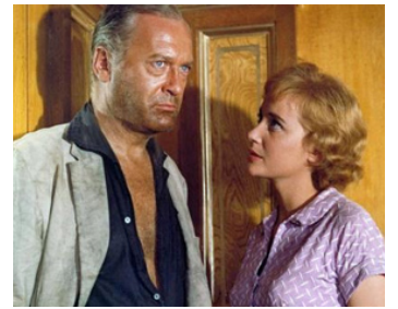
1959 VISA POUR HONG-KONG (Ferry to Hong Kong) de Lewis Gilbert avec Sylvia Syms