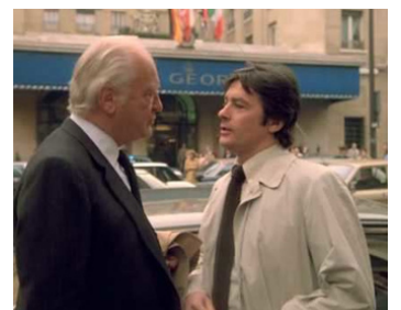
1981 TÉHÉRAN 43 (Teheran 43) d'Alexander Alov & Vladimir Naoumov avec Alain Delon