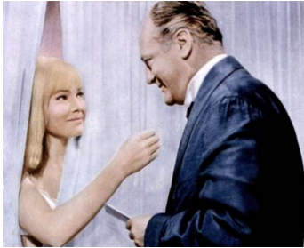
1959 L'ANGE BLEU (The blue Angel) d'Edward Dmytryk avec May Britt