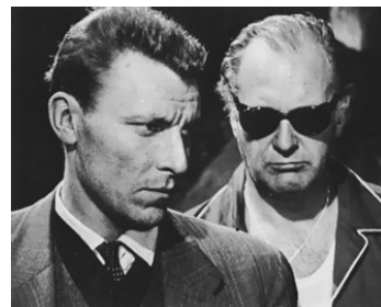
1957 LES ESPIONS d'Henri-Georges Clouzot avec Gérard Séty