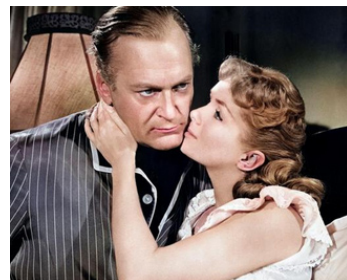
1958 LE DÉMON DE MIDI (This happy Feeling) de Blake Edwards avec Debbie Reynolds