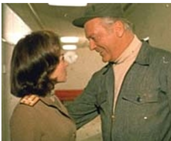
1966 DUEL À LA VODKA (Zwei Girls vom roten Stern) de Sammy Drechsel avec Lilli Palmer