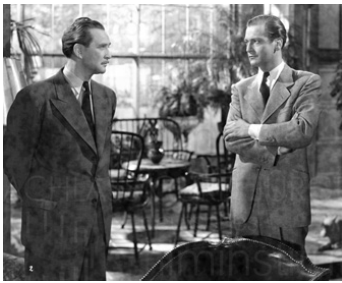
1943 L'ÉCOLE DE LA VIE (Ein glücklicher Mensch) de Paul Verhoeven avec Gustav Knuth