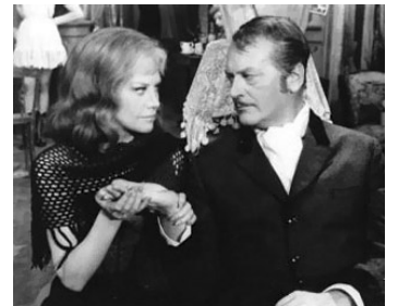
1962 L'OPÉRA DE QUAT' SOUS (Die dreigroschen Oper) de Wolfgang Staudte avec Hildegard Knef