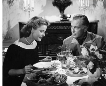
1953 TOUT POUR PAPA (Alles für Papa) de Karl Hartl avec Johanna Matz