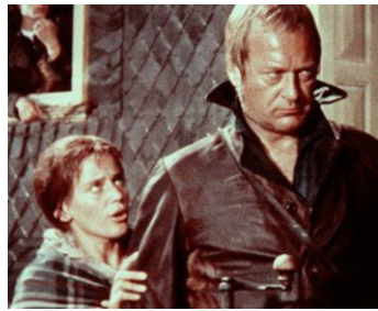
1958 LE BRIGAND AU GRAND CŒUR (Der Schinderhannes) d'H. Käutner avec Maria Schell