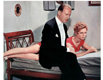
1956 ET DIEU CRÉA LA FEMME de Roger Vadim avec Brigitte Bardot