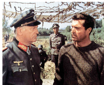
1967 LA GLOIRE DES CANAILLES (Dalle Ardenne all'inferno) d'A. de Martino avec Fr. Stafford