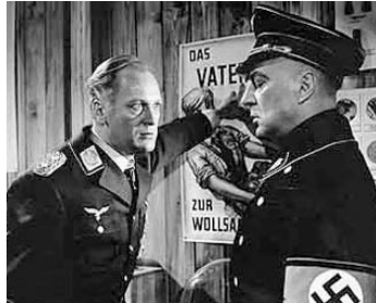
1954 LE GÉNÉRAL DU DIABLE (Des Teufels General) d'Helmut Käutner avec Viktor de Kowa