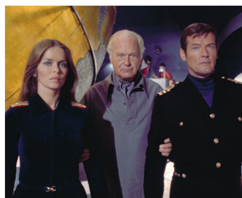
1977 L'ESPION QUI M'AIMAIT (The Spy who loved me) de L. Gilbert avec Barbara Bach, Roger Moore