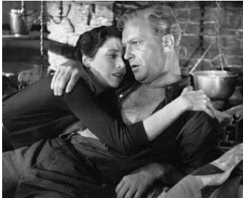
1954 LE DESTRUCTEUR (Das Bekenntnis der Ina Kahr) de G. W. Pabst avec Elisabeth Müller