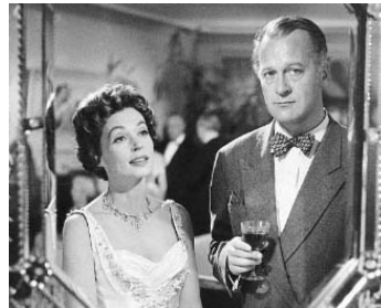
1956 LE DIABLE EN PERSONNE (Teufel in Seide) de Rolf Hansen avec Lilli Palmer