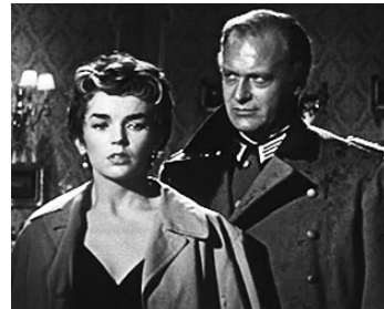
1956 LONDRES APPELLE PÔLE NORD (London ruft Polnord) de D. Coletti avec Dawn Addams