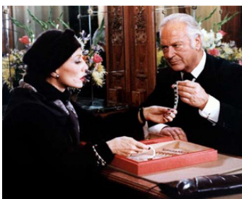
1975 FOLIES BOURGEOISES de Claude Chabrol avec Stéphane Audran