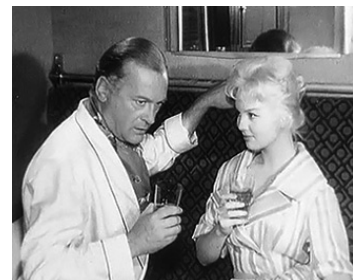
1958 LE VENT SE LÈVE d'Yves Ciampi avec Mylène Demongeot