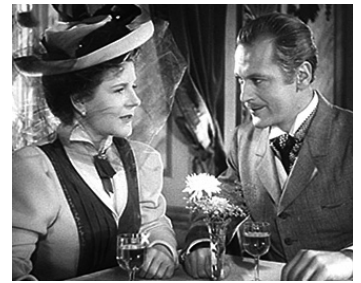
1948 L'ANGE À LA TROMPETTE (Der Engel mit der Posaune) de Karl Hartl avec Paula Wessely