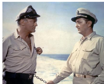
1957 TORPILLES SOUS L'ATLANTIQUE (The enemy below) de Dick Powell avec R. Mitchum