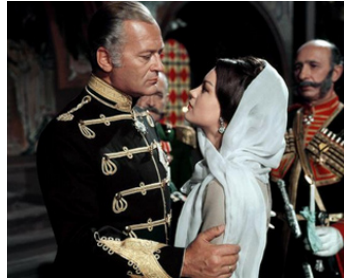
1959 KATIA (Katja, die ungekrönte Kaiserin) de Robert Siodmak avec Romy Schneider