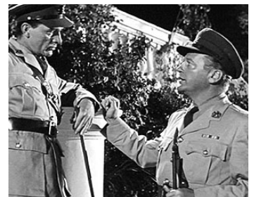
1957 AMÈRE VICTOIRE (Bitter Victory) de Nicholas Ray avec Richard Burton