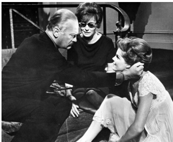
1963 LE DÉSIR (Psyche 59) d'Alexander Singer avec Patricia Neal, Samantha Eggar