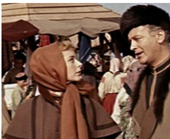
1956 MICHEL STROGOFF (Michele Strogoff) de Carmine Gallone avec Geneviève Page