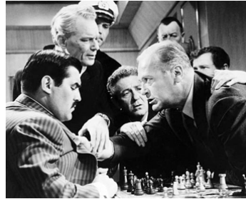
1960 LE JOUEUR D'ÉCHECS (Die Schachnovelle) de Gerd Oswald avec Mario Adorf