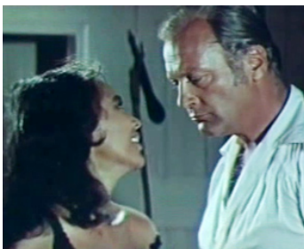
1957 TAMANGO (La Rivolta dell'Esperanza) de John Berry avec Dorothy Dandridge