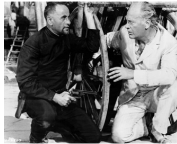
1964 LORD JIM (Lord Jim) de Richard Brooks avec Eli Wallach