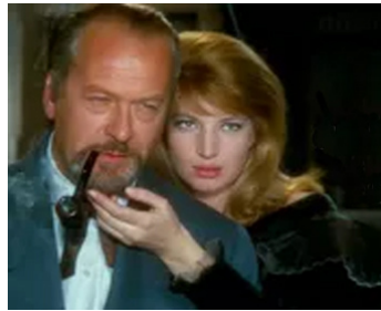
1963 CHÂTEAU EN SUÈDE de Roger Vadim avec Monica Vitti