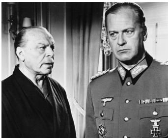
1961 LE JOUR LE PLUS LONG (The longest Day) de Gerd Oswald avec Paul Hartmann