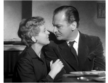
1954 UNE FEMME DE TÊTE (Eine Frau von Heute) de Paul Verhoeven avec Luise Ullrich