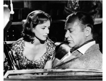
1960 L'HOMME DES FUSÉES SECRÈTES (I aim at the stars) de J. Lee-Thompson avec Gia Scala