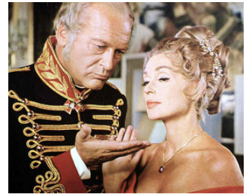
1965 LE CONGRÈS S'AMUSE (Der Kongreß amüsiert sich) de G. von Radvanyi avec L. Palmer