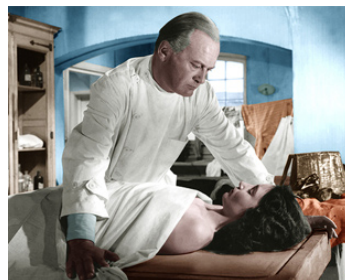
1956 CŒIL POUR CŒIL d'André Cayatte avec Lea Padovani