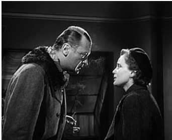
1955 LES RATS (Die Ratten) de Robert Siodmak avec Maria Schell