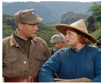
1958 L'AUBERGE DU 6 e BONHEUR (The Inn of the sixth happiness) de M. Robson avec Ingrid Bergman