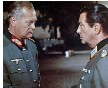
1962 LE GRAND RETOUR (Miracle of the white Stallions) d'Arthur Hiller avec Robert Taylor