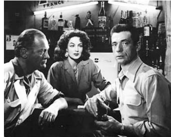
1955 LES HÉROS SONT FATIGUÉS d'Yves Ciampi avec Maria Felix, Yves Montand