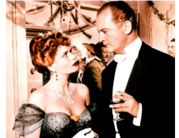
1955 ORIENT-EXPRESS (Orientexpress) de Carlo Ludovico Bragaglia avec Eva Bartok