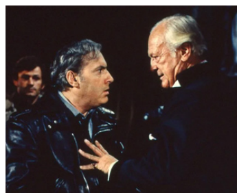
1979 LA GUEULE DE L'AUTRE de Pierre Tchernia avec Michel Serrault