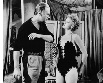
1954 CIRQUE D'AMOUR ((Rummelplatz der Liebe) de Kurt Neumann avec Eva Bartok